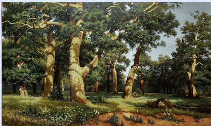
И.И.Шишкин «Дубовая роща», «Сосновый бор»