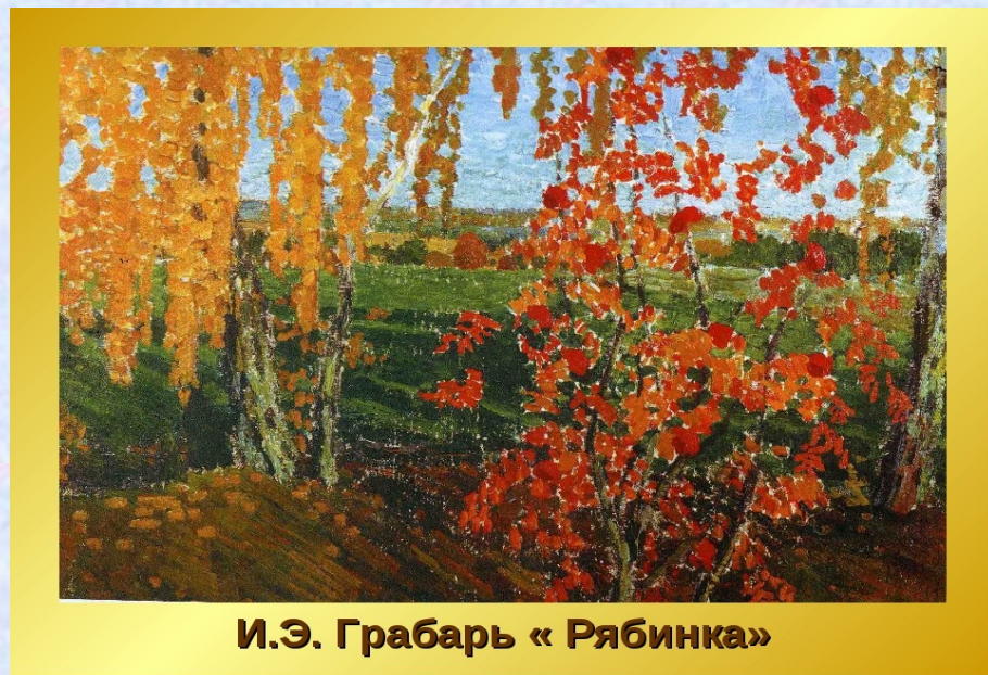
И.Э. Грабарь «Рябинка»