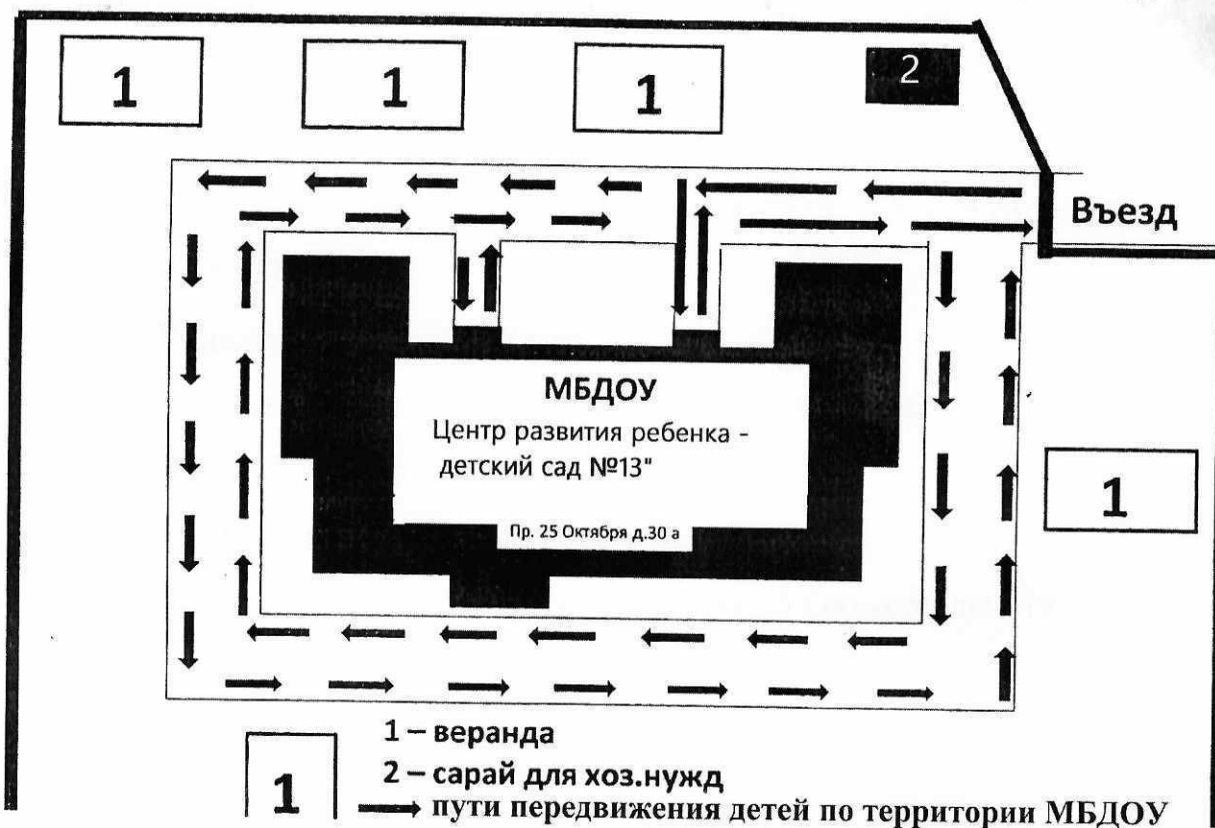
Пути передвижения детей и транспортных средств по территории МБДОУ